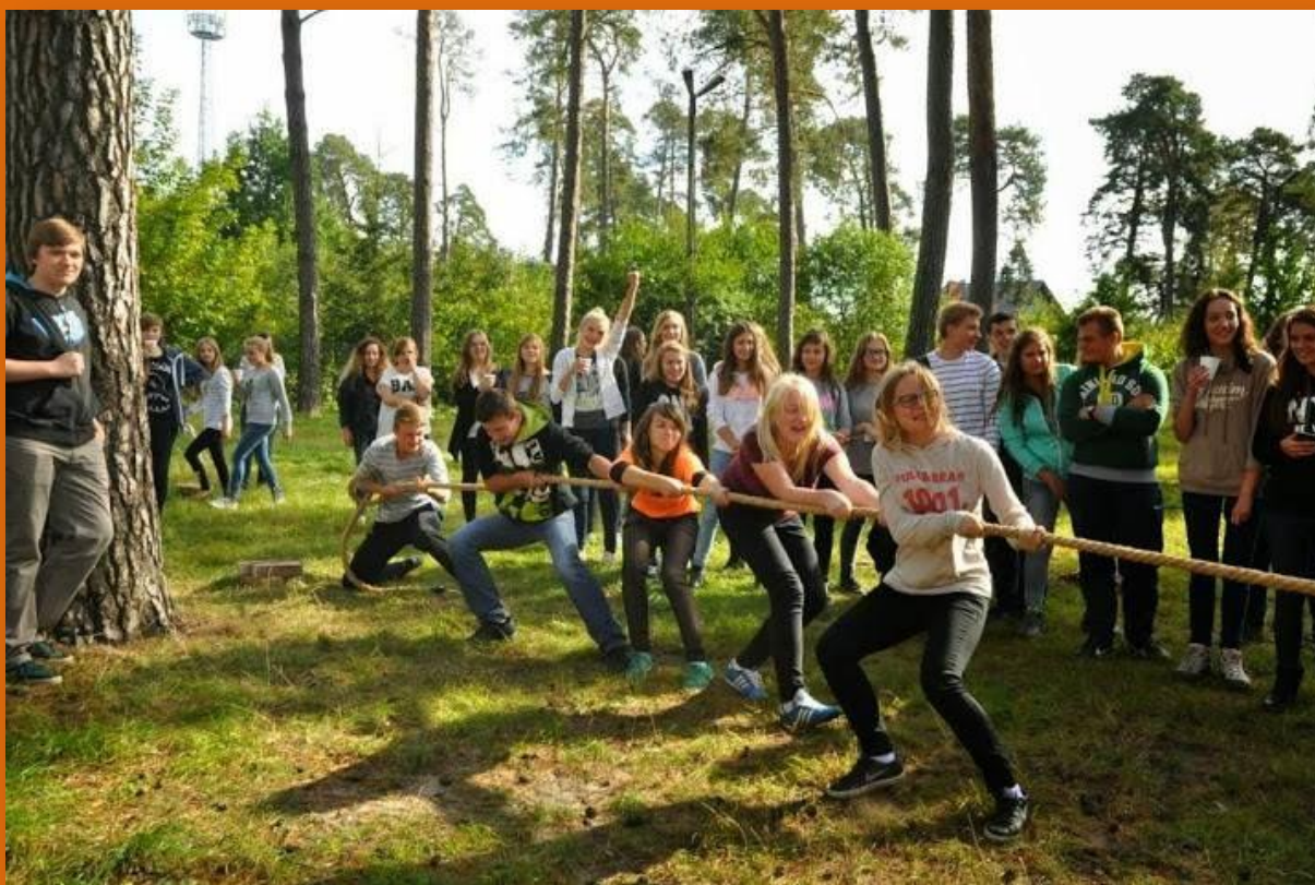
Fotografia i tekst – Natalia Wachnicka, klasa I b

Bardzo się cieszymy, że zostaliśmy tak serdecznie przyjęci przez nowych kolegów i koleżanki. Jesteśmy wdzięczni pani dyrektor oraz wszystkim nauczycielom, że podtrzymali tradycję i ponownie zorganizowali otrzęsiny „kociaków”.